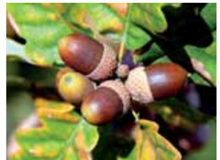
Reh und Flaumeiche

der Jungen auf die Baum-Busch-Vegetation, zum Nahrungs-erwerb jedoch auf die offene Feldflur angewiesen. Kastanien, Buchen, Nussbäume, Eschen, Vogelbeeren und Linden bieten den Spechten willkommene Bruthöhlen. An Nadelhölzern