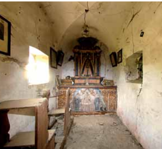
Der religiösen Volkskunst verdanken wir zahlreiche Bildstöcke und Kapellen; wie hier die Kapelle von 1736 beim Innerpeskoler

Die auf die Karolingerzeit zurückgehende Pfarre Völs umfasste ein großes bis ins Tierser und Eggental reichendes Gebiet. Die Gehzeiten zur Pfarrkirche variierten zwischen einer und vier Stunden. So errichteten die bäuerlichen Gemeinschaften , Mulgreien oder Malgreien genannt, ab dem 12./13. Jh. eigene Gotteshäuser im romanischen Stil , in die an bestimmten Feiertagen der Pfarrherr von Völs einen Gesellpriester entsandte. Die Kirchenpatrone gaben den Malgreien den Namen. Zu einer Zeit, als es noch keine öffentliche Fürsorge und keine Hagelversicherungen gab, wurden die Heiligen um Hilfe angerufen, und es waren auch die Eigenverwaltungen der einzelnen Kirchen, die aus den Spendengeldern und anderen Einkünften den Bauern in Notzeiten gegen Zinsen aushalfen. Daraus entwickelte sich eine innige Beziehung zwischen den Menschen und ihrer Kirche, die in deren Ausschmückung mit Fresken und Altären miteinander wetteiferten. Im 15. Jh., einer Blütezeit Tirols , wurden fast alle Filialkirchen von Völs, so auch St. Katharina in Völser Aicha, im gotischen Stil modernisiert.