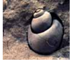
Steinkern eines Gastropoden, aus der Bellerophon Formation (vor ca. 255-250 Mio. Jahren)

Auf dem Porphy liegt der Grödner Sandstein , der zu fruchtbaren Kulturböden verwittert. Er fällt schon von weitem an den rötlichen Gesteinsschichten des Ritztales auf, das vom Tschafon abfallend die Gemeindegrenze zwischen Völs und Tiers bildet. An diesem Aufschluss kann man den geologischen Aufbau des Gebietes wie in einem Lehrbuch studieren. Auf den Grödner Sandstein folgen die gipshaltigen Bellerophon und die mergeligen Werfener Schichten , welche die ehemalige Überflutung des Festlandes durch das sogenannte Tethysmeer bezeugen. Typische Fossilien der Werfener Schichten sind Schnecken und Muscheln.