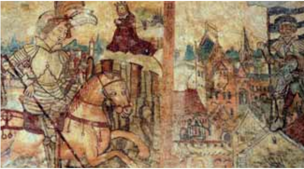
Am Fingerhof schirmt ein tief herabhängendes Vordach den Rundbogeneingang mit einem Fresko aus dem 13. Jh. ab; es zeigt den Hl. Georg, die Hl. Margareth sowie den Hl. Florian

So ist es nicht verwunderlich, aber zugleich architektonisch bemerkenswert, dass in mehreren Bauernhäusern noch uralte Bausubstanz erhalten ist: in Form von Grundmauern und Kellergewölben, in Form von Torbögen und Wandfresken, von Hausfluren und Wohnstuben.