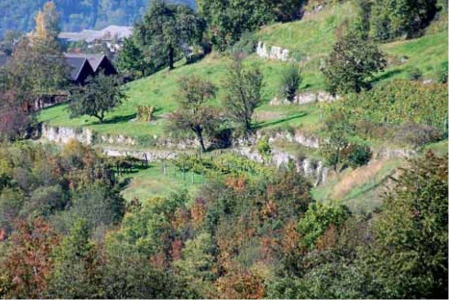
Grenzlinie zwischen Wald und Wiesen

Schlehe und Weichselkirsche auf. Neben der Flaumeiche und der Manna-Esche gedeihen hier auch Perückenstrauch, Blasenstrauch und Kornelkirsche. In lichten Buschwäldern und auf Trockenrasen sind mehrere submediterrane Arten wie Blauer Lattich, Schwalbenwurz, Astlose Graslilie, Gemei-