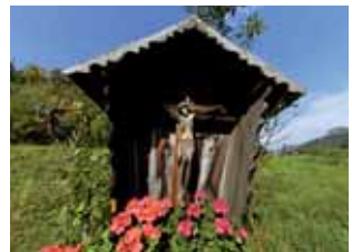
Wegkreuze luden zum Gebet ein oder dienten als Totenrast auf dem weiten Weg zum Friedhof in Völs

Einige Höfe, so der Gemoaner und der Außerpeskoler am Höfeweg, hatten eigene kleine Kapellen, wo die Familie ihr Rosenkranzgebet verrichtete.