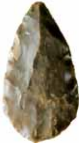
Große retuschierte Silexspitze vom Schnaggen

Bei Grabungsarbeiten für die Bewässerungsanlage um Völser Aicha wurden 1978 eindeutige Indizien menschlicher Tätigkeiten aus der Zeit zwischen der jüngeren Steinzeit (Neolithikum) und der römischen Landnahme gewonnen. Anscheinend hatten sich hier bereits die ersten Bewohner die Fruchtbarkeit des Bodens zu Nutze gemacht.