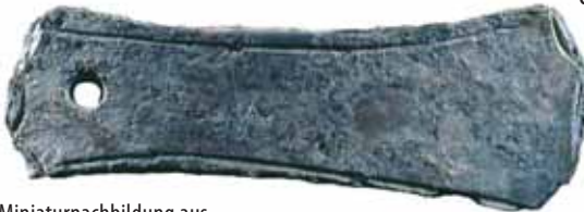
Miniaturnachbildung aus Blei eines frühbronzezeitlichen Bronzebeiles, gefunden in unmittelbarer Nähe von Schloss Prösels

Erste Anzeichen menschlicher Eingriffe gehen auf die Zeit vor rund 6.000 Jahren zurück, als sich Gemeinschaften jungsteinzeitlicher Bauern im Bereich der heutigen Höfe Finger und Zafluner niederließen. Die terrassenartigen, flachen und gut beschienenen Böden waren relativ leicht zu beackern. Archäologische Grabungsarbeiten und Untersuchungen zeigten, dass im Gelände um Völser Aicha an mehreren Stellen durch