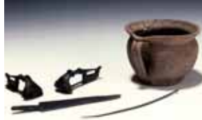
Beigaben aus einem Brandgrab der römischen Nekropole beim Kompatscher Hof in Völser Aicha

Während der römischen Herrschaft entstanden zwischen Prösels und Tiers auch dank der ausgedehnten und klimamäßig begünstigten, leicht zu bearbeitenden Flachlagen mehrere Landgüter . Die weite Hochebene bei Gfell bot hierfür besonders ideale Bedingungen. Als Bestattungsplatz wählten die Bewohner die Anhöhe vor dem Hof Kompatsch. Die Begräbnisstätte besaß eine gewisse Monumentalität: einzelne Gräber waren mit einem Grabstein mit Namen und Alter des Verstorbenen versehen.