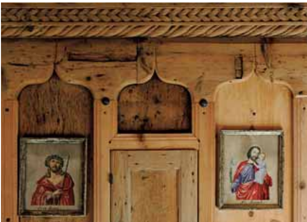
Detail der beeindruckenden gotischen Stube beim Unterspenn