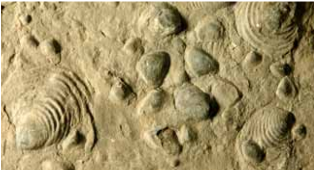
Claraia clarai (Emmrich). Abdruck von verschiedenen Muscheln aus der Werfener Formation (vor ca. 250-245 Mio. Jahren)

Die prächtige Kulisse des Rosengartens ist ein versteinertes Korallenriff. Zur Zeit ihrer Entstehung mag die Landschaft einem heutigen Südsee-Archipel geglichen haben.