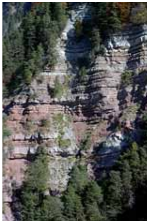
Einblick in die geologischen Schichtfolgen, Ritztal / Breien

klimatisch günstiger gelegenen Sonnenhang liegt Völser Aicha, ein uraltes Bauernland mit verstreuten Höfen. Der Blick schweift auch hinunter in den Talkessel von Bozen. Die hier gut erkennbaren Gesteinsabfolgen der Dolomiten zeugen von Ablagerungen, die vor rund 280 bis 240 Millionen Jahren entstanden sind.