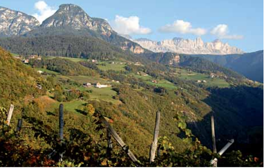
Blick vom Gemoaner in das Tierser Tal mit dem Rosengarten im Hintergrund

Der Gemoaner ist ein bekannter Weinhof und Buschenschank in Unteraicha. Von hier aus überschaut man das gesamte Tierser Tal mit dem Rosengarten im Hintergrund. Von der gegenüberliegenden Talseite grüßt die Ortschaft Steinegg. Am