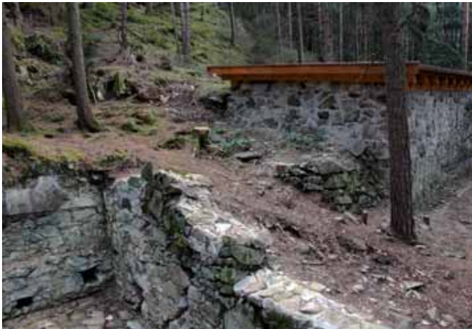
Der Wirtskeller im Prösler Ried; im Hintergrund das wieder errichtete Gebäude, vorne links sind die Austrittslöcher der Kaltluft zu erkennen

Zwischen den Gesteinsblöcken einer Bergsturzhalde strömt kalte Luft aus. Dieses Kältephänomen entsteht nach dem Prinzip der „Windröhren“. Ein System von Kanälen mit Öffnungen auf unterschiedlicher Höhe durchzieht das Gelände. Ist die Luft in den Kanälen kühler als die Außenluft, so sinkt sie nach unten und saugt oben warme Luft nach. Die durchströmende schwere Luft nimmt auch Wasserdampf auf und kühlt infolge der Abgabe von Verdunstungswärme ab. Die kalte und feuchte Luft bläst dann am unteren Ende der Windröhren heraus. Die Temperatur der austretenden Luft