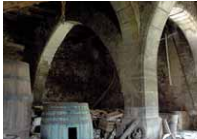
Beachtenswert ist der Keller des Fronthofes mit Sandsteinpfeiler und vier gewaltigen Bögen

Wiewohl es sich um bescheidene, unauffällige Elemente handelt, gelten diese Bauernhöfe als Denkmäler von unvergänglichem Kulturwert und sind Juwelen verborgener Schönheit. Manches mag dem Auge des interessierten Wanderers verborgen bleiben, da es der familiären Privatsphäre angehört oder nicht nah genug an der markierten Route liegt; dennoch wird er – außer dem Gesamteindruck, wie die Bauernhäuser im Gelände angelegt und aufgebaut sind – mehrere kunstreiche Details aus nächster Nähe und genau betrachten können. Die alten getäfelten Stuben, etwa beim Gemoaner und beim Front, laden im Herbst zum Törggelen ein.