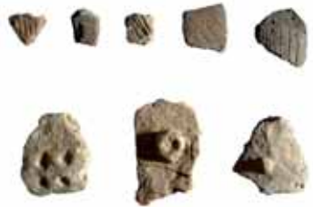
In der Nähe des Finger Hofes zum Vorschein gekommene Bruchstücke von Gefässen aus Ton aus der späten Jungsteinzeit