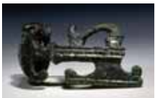
Kleine Bronzefibel in Form einer Axt aus der römertimeitlichen Nekropole beim Kompatscher Hof in Völser Aicha

In der Bronzezeit und später in der Eisenzeit wurde die Gegend um Prösels, Zafluner, Finger sowie jene um die Höfe Kompatsch, Mongadui und Federer, aber auch das Gebiet um Großsteinegg und Schnaggen zur Anlage von Siedlungen gewählt (ca. zwischen 2000 v. Chr. und 100 v. Chr.). Die Siedler bestritten ihren Lebensunterhalt mit Ackerbau und Viehzucht . Zudem nutzten sie intensiv die alpinen Hochlagen : auf der Seiser Alm, am Schlern sowie auf dem Tschafon konnten saisonal genutzte vorgeschichtliche Stationen wirtschaftlicher und religiöser Natur belegt werden.