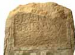
Grabstele der Severa aus der römischen Nekropole beim Kompatscher Hof

Da in römischer Zeit Nekropolen meist in der Nähe von Durchzugsstraßen angelegt wurden, ist anzunehmen, dass zwischen dem Eisacktal und dem Fassa-Gebiet ein Verbindungsweg über den Nigerpas geführt haben muss. Die archäologischen Fundstätten längs der Geländeterrassen bei Tiers zeugen von einer solchen Verbindung, die sowohl in früheren als auch in späteren Epochen bestanden haben dürfte. Einige Abschnitte des heutigen Höfe-Weges sind möglicherweise mit dem vorgeschichtlichen Verbindungsweg identisch.