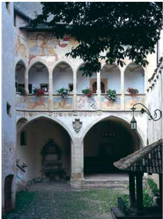
Der Innenhof mit Loggia