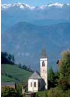
Die Kirche St. Katharina liegt am uralten Verbindungsweg zwischen dem Eisacktal und dem dolomitenladinischen Raum

Die auf die Karolingerzeit zurückgehende Pfarre Völs umfasste ein großes bis ins Tierser und Eggental reichendes Gebiet. Die Gehzeiten zur Pfarrkirche variierten zwischen einer und vier Stunden. So errichteten die bäuerlichen Gemeinschaften , Mulgreien oder Malgreien genannt, ab dem 12./13. Jh. eigene Gotteshäuser im romanischen Stil , in die an bestimmten Feiertagen der Pfarrherr von Völs einen Gesellpriester entsandte. Die Kirchenpatrone gaben den Malgreien den Namen. Zu einer Zeit, als es noch keine öffentliche Fürsorge und keine Hagelversicherungen gab, wurden die Heiligen um Hilfe angerufen, und es waren auch die Eigenverwaltungen der einzelnen Kirchen, die aus den Spendengeldern und anderen Einkünften den Bauern in Notzeiten gegen Zinsen aushalfen. Daraus entwickelte sich eine innige Beziehung zwischen den Menschen und ihrer Kirche, die in deren Ausschmückung mit Fresken und Altären miteinander wetteiferten. Im 15. Jh., einer Blütezeit Tirols , wurden fast alle Filialkirchen von Völs, so auch St. Katharina in Völser Aicha, im gotischen Stil modernisiert.