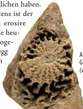
Ammonit aus der Familie der Gymnitidae, Schlerndolomit (vor ca. 235-230 Mio. Jahren)

Der Hauptfelsbildner des Rosengartens ist der Schlerndolomit . Tektonische und erosive Kräfte gaben dem ehemaligen Riff die heutige Form. Durch die Störung der sogenannten „Tierser Linie“, die über Steinegg und Karneid bis ins Bozner Talbecken reicht, ist der Rosengarten um etwa 800 m höher gehoben worden als der Schlern.